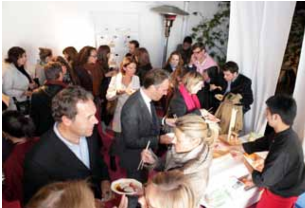
Wine & Chocolate 2011