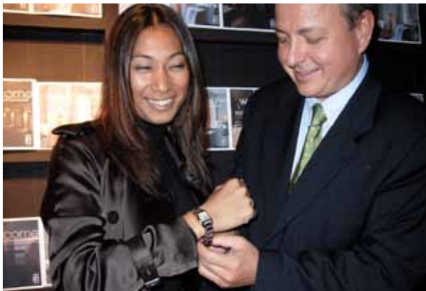
Beaume & Mercier 2007