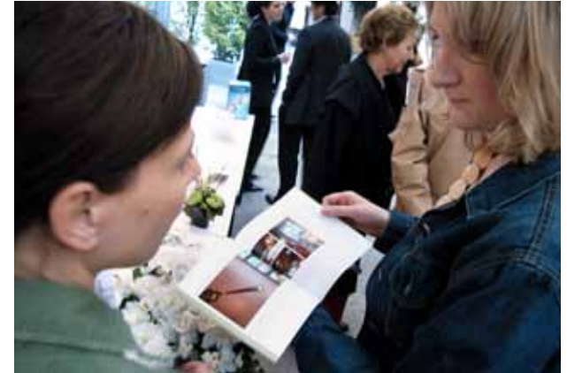
Bentjeman & Barton 2009