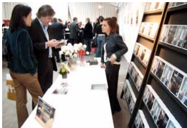
Wellcome guides 2006