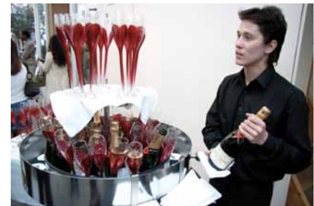
Hip Beauty Product 2005