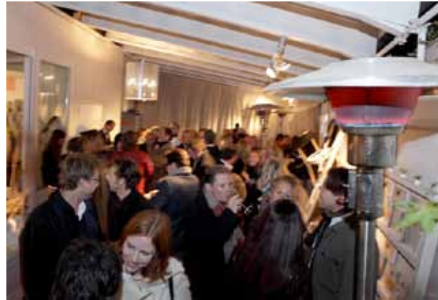
Hermès & Nomad 2010